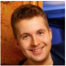
Tim Gailus - TV-Moderator KiKA

Es gibt kein Marketing-Budget. Wir wachsen jedes Jahr nur durch Mundpropaganda auf mittlerweile 150 Teilnehmer . Und mehr passen auch nicht rein.