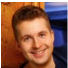
Tim Gailus - TV-Moderator KiKA

Es gibt kein Marketing-Budget. Wir wachsen jedes Jahr nur durch Mundpropaganda auf mittlerweile 200 Teilnehmer . Und mehr passen auch nicht rein.